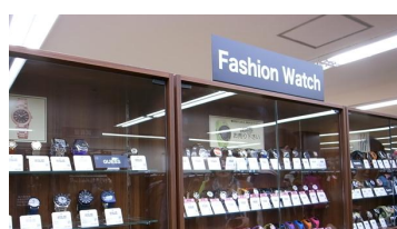
腕時計は数百円〜ブランドまで