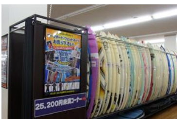
サーフボード、ゴルフ、野球、テニス等、スポーツ用品一式