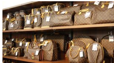
ブランドバッグコーナー