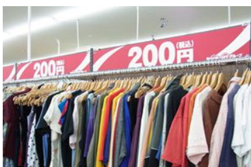
洋服の200円コーナー