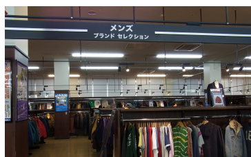
メンズ・レディース・子供服は人気ブランドからノンブランドまで