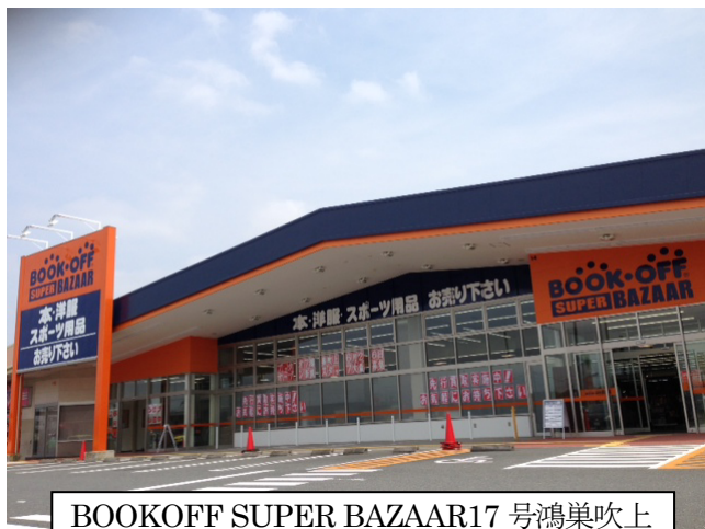
BOOKOFF SUPER BAZAAR17 号鴻巣吹上

同店は、本・CD・DVD・ゲームソフトはもちろん、携帯電話、アパレル(レディース、メンズ、キッズ)、服飾雑貨(バッグ、帽子、靴など)、スポーツ用品、腕時計・ブランドバッグ、貴金属、ホビー商材などを取り扱う、リユースの大型複合店です。