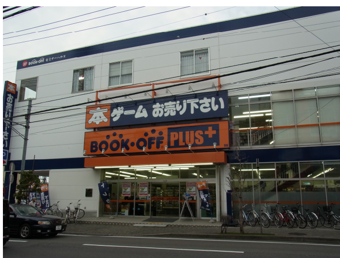
この画像は BOOKOFF PLUS 古淵駅前店です

同店は、2013年4月に閉館した大宮ロフトの後継施設として6月27日(金)にオープンする複合商業施設「大宮ラクーン」への出店となります。